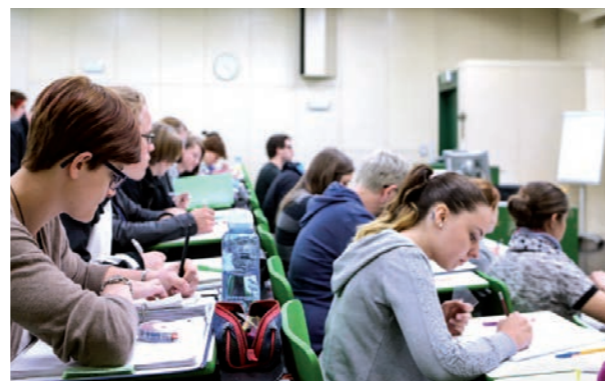
Private Pädagogische Hochschule der Diözese Linz