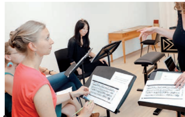
Anton Bruckner Privatuniversität

LiLeS Service-Center Hauptplatz 6 4020 Linz