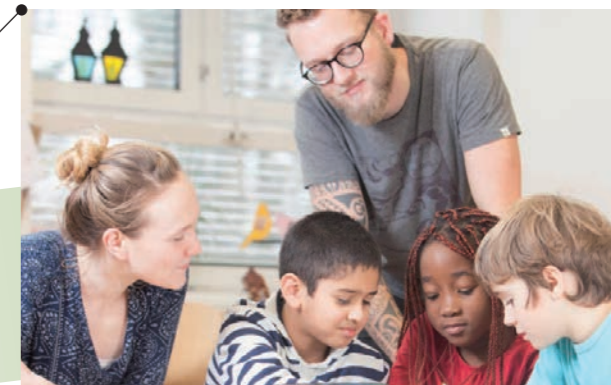
Pädagogische Hochschule Oberösterreich