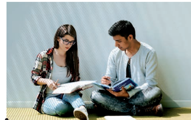
JKU Johannes Kepler Universität Linz