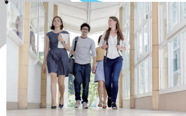
Katholische Privat-Universität Linz